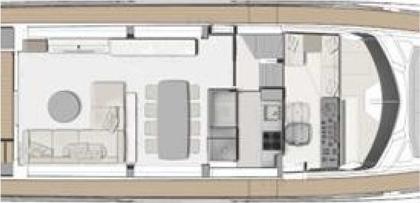
3D rendering of the interior space, showing the layout and furniture.